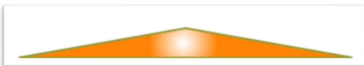
Lettera C- riempimento con sfumatura radiale